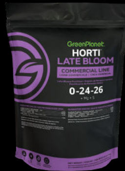
HORTI LATE BLOOM 0-24-26 + Mg + S