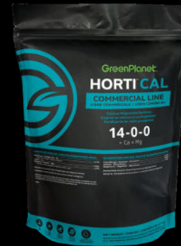
HORTI CAL 14-0-0 + Ca + Mg