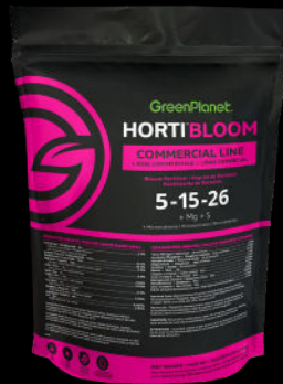
HORTI BLOOM 5-15-26 + Mg + S + Micronutrientes