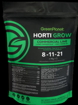
HORTI GROW 8-11-21 + Mg + S + Micronutrientes